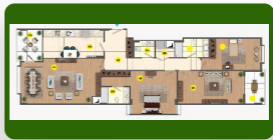
ثلاث غرف و صالة