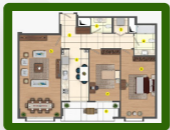
غرفتين و صالة