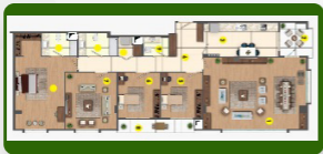
أربع غرف و صالة